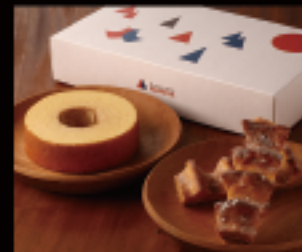
バウムセット (S) はちやバウム (S) : 1個 250g、 直径約14cm × 高さ約4cm ろっくバウムスティック : 2個 (1個100g)、長さ約15cm

しっとりふわふわの「はちやバウム」と、 カリッとモチモチ食感の「ろっくバウム」がセットに