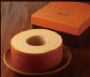
はちやバウム (L) 1個 800g 直径約17cm × 高さ約8cm