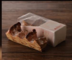
ろっくバウムスティック 1個 100g 長さ約15cm