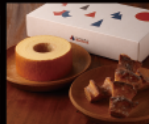
バウムセット (M) はちやバウム (M) : 1個 410g、 直径約14cm × 高さ約6cm ろっくバウムスティック : 2個 (1個100g)、長さ約15cm