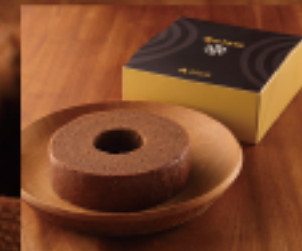
冬のショコラ (S) 1個 270g 直径約14cm × 高さ約4cm