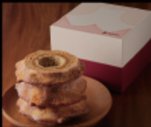
ろっくバウム (L) 1個 600g 直径約13cm × 高さ約12cm