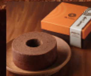
冬のショコラ (M) 1個 410g 直径約14cm × 高さ約6cm