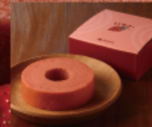
はちやバウム いちご (S) 1個 280g 直径約14cm × 高さ約4cm