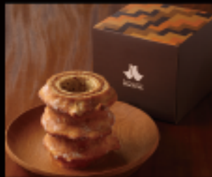
ろっくバウム (S) 1個 300g 直径約8.5cm × 高さ約12cm