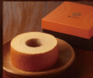
はちやバウム (M) 1個 410g 直径約14cm × 高さ約6cm