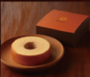
はちやバウム (S) 1個 250g 直径約14cm × 高さ約4cm